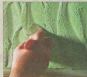
ACOPERIRE CU LAZURĂ