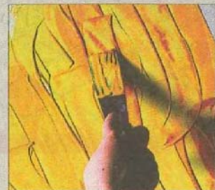
ȘPACLU ÎN TUȘĂ LUNGĂ

tipuri de texturi sau modele. După aplicare, când produsul începe să se usuce, finisarea se poate realiza cu o simplă spatulă. Aplicarea nu necesită cunoștințe în domeniul tehnicilor de decorare a pereților, se face rapid și ușor. Pentru a obține efecte speciale cât mai diverse, putem lucra și cu lazuri, care sunt vopsele decorative colorate transparente, care se aplică peste un strat de